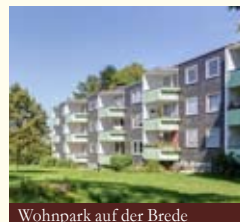
Wohnpark auf der Brede