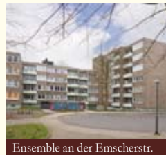
Ensemble an der Emscherstr.