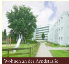
Wohnen an der Arndstraße