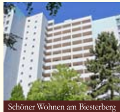
Schöner Wohnen am Biesterberg