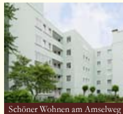
Schöner Wohnen am Amselweg