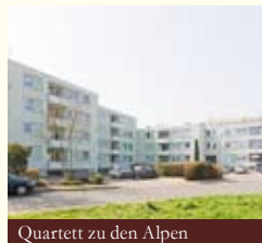
Quartett zu den Alpen