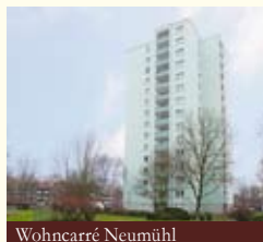
Wohn Carré Neumühl