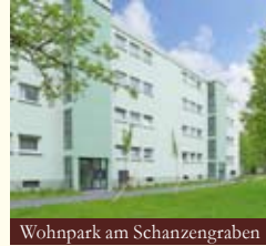
Wohnpark am Schanzengraben