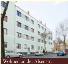
Wohnen an der Alsenstr.