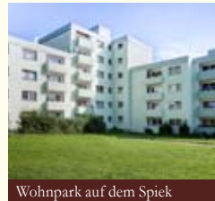
Wohnpark auf dem Spiek