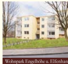
Wohnpark Engelhöhe u. Elfenhang