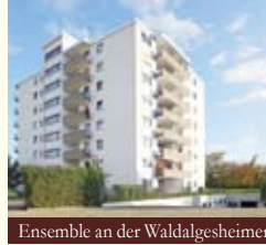
Ensemble an der Waldalgesheimer