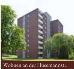
Wohnen an der Husemannstr.